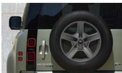
20" (wzór 5094) - Satin Dark Grey 3