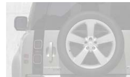
20" (wzór 1086) Satin Dark Tint / Satin Black z wykończeniem Diamond Turned 7,8