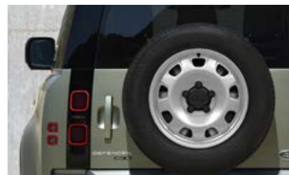
20" (wzór 9013) Gloss White 5