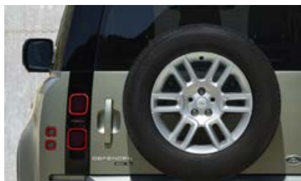
19" (wzór 6010) 2