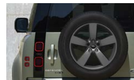
20" (wzór 5098) - Satin Dark Grey 3