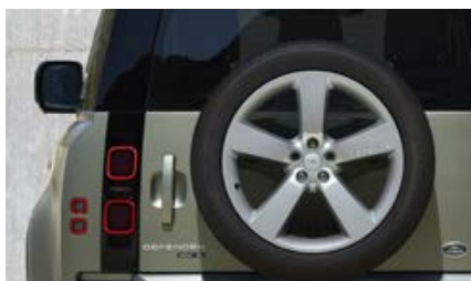
22" (wzór 5098) Sparkle Silver 6