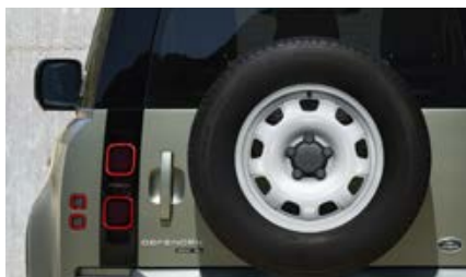
18" stalowe (wzór 5093) - Gloss White 1