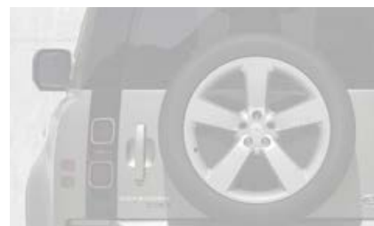
22" (wzór 7026) Gloss Black z wykończeniem Diamond Turned 6,8