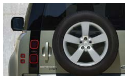
20" (wzór 5098) Sparkle Silver 3