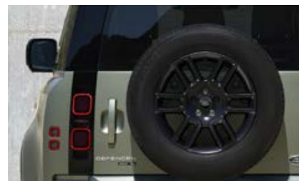
19" (wzór 6010) - Gloss Black 2