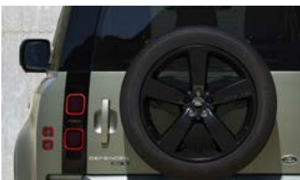
22" (wzór 5098) - Gloss Black 6