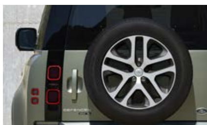
20" (wzór 5095) - Gloss Grey & Diamond Turned 3