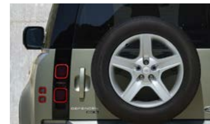
20" (wzór 5094) 3