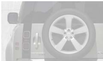
20" (wzór 6011) - Gloss Black 4