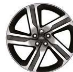
22" 5-RAMIENNE 'WZÓR 5124' DARK GREY & DIAMOND TURNED 4