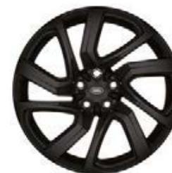
21" 5-RAMIENNE 'WZÓR 5025' GLOSS BLACK 3