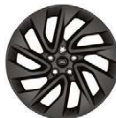
20" 5-RAMIENNE 'WZÓR 5122' SATIN DARK GREY 2