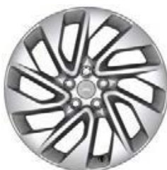
20" 5-RAMIENNE 'WZÓR 5122' 2