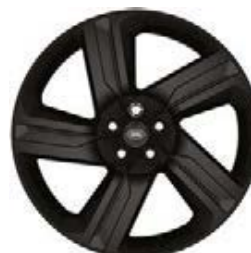
22" 5-RAMIENNE 'WZÓR 5124' GLOSS BLACK 4