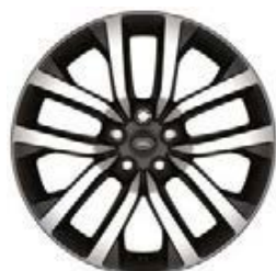
21" 5-RAMIENNE 'WZÓR 5123' DARK GREY & DIAMOND TURNED 3