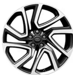
22" 5-RAMIENNE, "WZÓR 5025" DIAMOND TURNED/SATIN DARK GREY 4