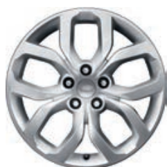
19" 5-RAMIENNE 'WZÓR 5021' 1