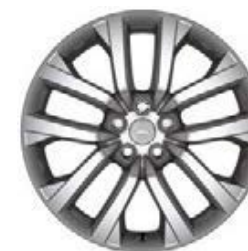
21" 5-RAMIENNE 'WZÓR 5123' 3